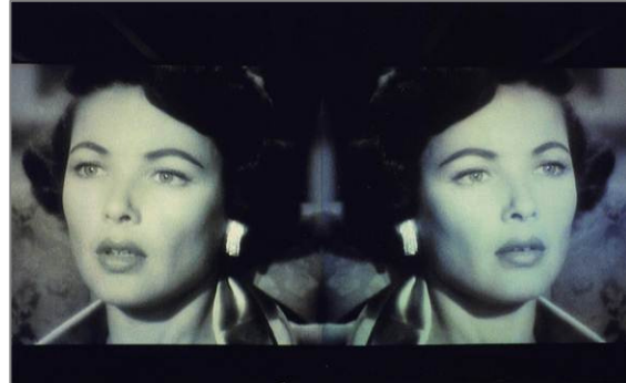
Douglas Gordon, L'esquerra és correcta i la dreta és incorrecta, i l'esquerra és incorrecta i la dreta és correcta , 1999. Col·lecció "la Caixa" d'Art Contemporani. © Vegap, Barcelona, 2014