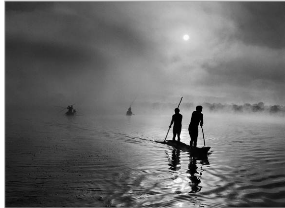
A la regió de l'Alt Xingú, a l'estat brasiler de Mato Grosso, un grup de wauràs pesquen al llac Piyulaga, prop del seu poblat. La població de la conca de l'Alt Xingú presenta una gran varietat ètnica. Brasil, 2005.

Arriba a CaixaForum Barcelona el projecte d'aquest fotògraf brasiler, que durant vuit anys ha explorat la bellesa de la natura arreu del món