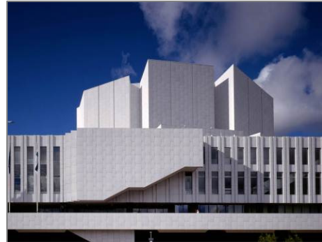
Alvar Aalto, Sala de concerts i centre de convencions. Finlàndia, Hèlsinki, 1962-1971