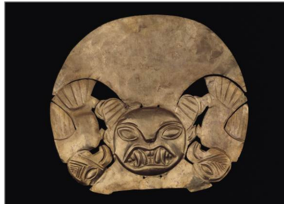
Corona con rostro de felino y guacamayos, mochica. Época Auge (1-800 dC). Museo Larco Herrera, Perú