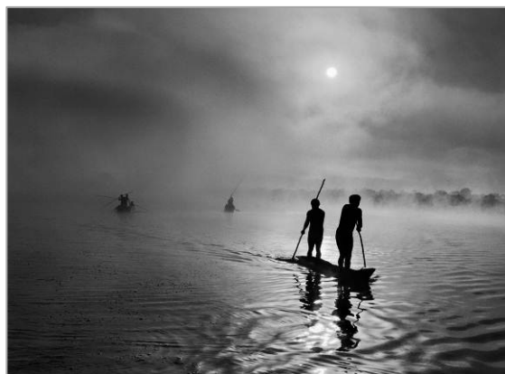
En la región del Alto Xingú, en el estado brasileño de Mato Grosso, un grupo de waurás pescan en el lago Piyulaga, cerca de su aldea. La población de la cuenca del Alto Xingú presenta una gran variedad étnica. Brasil. 2005.

Llega a CaixaForum Barcelona el proyecto de este fotógrafo brasileño, quien durante ocho años ha explorado la belleza de la naturaleza en todo el mundo