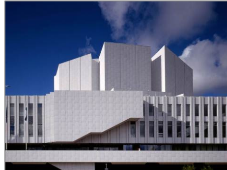
Alvar Aalto, Sala de conciertos y centro de convenciones. Finlandia, Helsinki, 1962-1971.